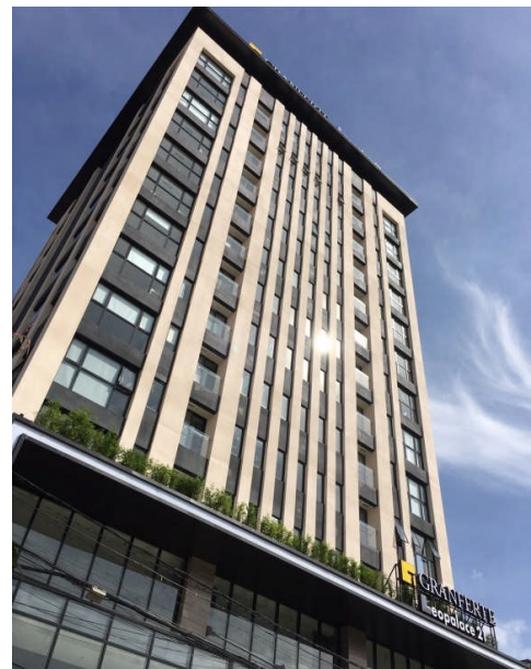
「グランフェルテ プノンペン」外観

http://www.leopalace21.co.jp/sa/phnompenh/