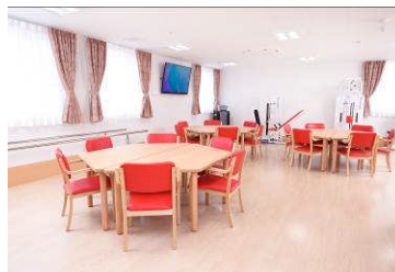
あずみ苑前橋 デイサービス食堂兼機能訓練室