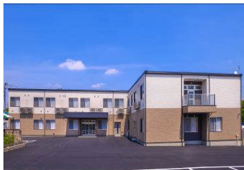
あずみ苑前橋 外観

・あずみ苑前橋 http://www.azumien.jp/search/maebashi/