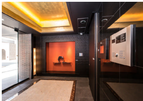
LOVIE 麻布十番 エントランス

レオパレス 21 は賃貸住宅 IoT 化を目指し、これまでにスマートフォンによる家電制御機器である「Leo Remocon」やネットワーク連携型スマートロックである「Leo Lock」の導入など、賃貸住宅の IT 化を進めています。2017 年 7 月 31 日に竣工した「LOVIE 麻布十番」には賃貸物件初となる顔認証のみでエントランスのロックを開錠できるシステムを導入しました。レオパレス 21 は現在、銀座東に不動産特定共同事業商品の「LOVIE」シリーズの建築を進めており、2018 年 1 月末の竣工を予定しております。本物件は住宅の IoT 化を実現する「Leo Remocon」、「Leo Lock」、「エントランス顔認証システム」の全てを搭載しており、賃貸業界初の IT 賃貸物件となる見込みです。