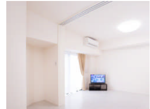
LOVIE 文京音羽 居室