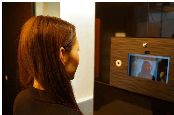
LOVIE 麻布十番 顔認証システム