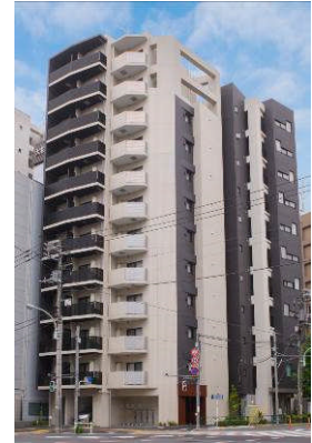
LOVIE 文京音羽 外観