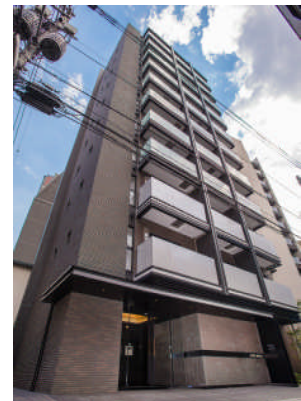
LOVIE 麻布十番 外観