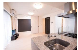
LOVIE 麻布十番 居室