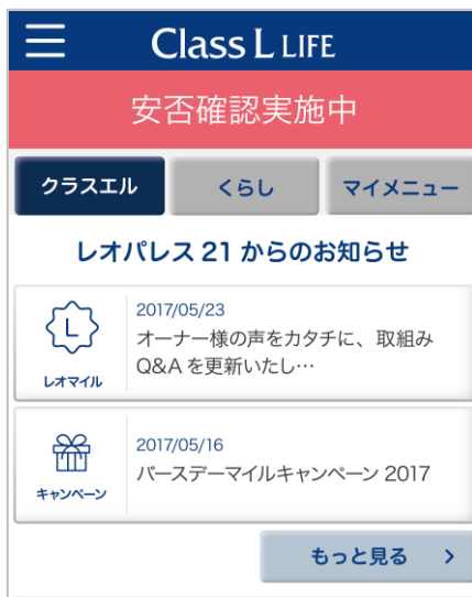
安否確認実施画面

株式会社レオパレス21(本社:東京都中野区、社長:深山英世、以下レオパレス21)は、オーナー様とご家族に対し、安否確認機能ならびに、災害情報の提供が可能なオーナー様専用のアプリ「ClassL LIFE(クラスエル ライフ)」の提供を11月2日より順次開始致します。