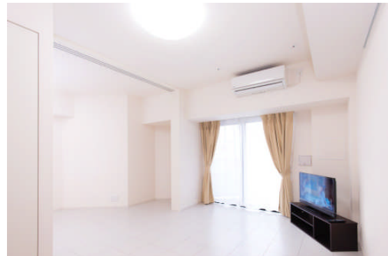
LOVIE 文京音羽 居室

レオパレス 21 は、2017年10月20日、国土交通省・金融庁から不動産特定共同事業者としての許可を受け、「LOVIE 麻布十番」、「LOVIE 文京音羽」の2棟を投資対象不動産として『LOVIE 第一号任意組合』の募集を開始し、好評のうちに組合組成が完了いたしました。「LOVIE 麻布十番」、「LOVIE 文京音羽」はともに東京都の中心エリアに位置する優良物件で、「LOVIE 麻布十番」は賃貸業界で初めて「エントランス顔認証システム」を導入した物件です。