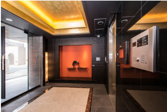
LOVIE 麻布十番 エントランス

株式会社レオパレス 21(本社:東京都中野区、社長:深山英世、以下:レオパレス 21)は、「LOVIE 麻布十番」、「LOVIE 文京音羽」を投資対象不動産とし、任意組合型のスキームを利用した不動産特定共同事業商品である『LOVIE 第一号任意組合』を、12月18日に総額24億6千万円で組成完了し、2018年1月より不動産運用を開始します。