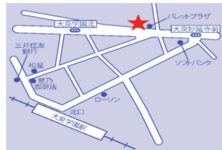
レオパレスパートナーズ大泉学園駅前店 地図