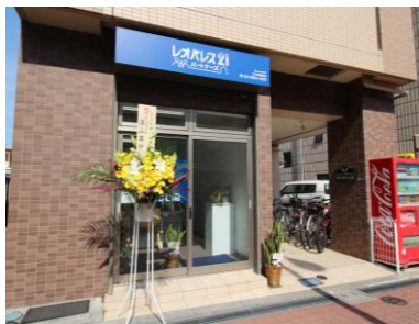
レオパレスパートナーズ大泉学園駅前店 外観