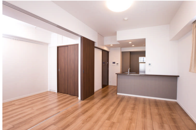
LOVIE 銀座東 居室

レオパレス 21 は、2018年1月15日より、東京都の中心エリアに位置する「LOVIE 銀座東」を投資対象不動産として『LOVIE 第二号』任意組合の募集を開始し、多くのお客様にご出資いただいた結果、好評のうちに組合組成が完了いたしました。「LOVIE 銀座東」は、レオパレス 21 が取り組む賃貸住宅 IoT 化を実現する「Leo Remocon」、「Leo Lock」、「エントランス顔認証システム」の全てを導入した当社初の賃貸物件であり、最新鋭 IoT 賃貸住宅として安定的な賃貸需要を得ることが期待されています。