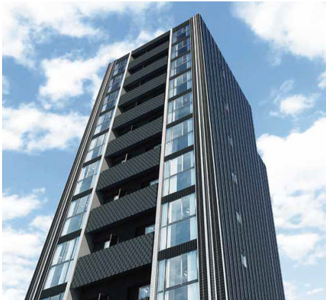
LOVIE 銀座東 外観

株式会社レオパレス 21(本社:東京都中野区、社長:深山英世、以下:レオパレス 21)は、「LOVIE 銀座東」を投資対象不動産とし、任意組合型のスキームを利用した不動産特定共同事業商品である『LOVIE 第二号』任意組合を、3月8日に総額14億円で組成完了し、2018年3月より不動産運用を開始します。