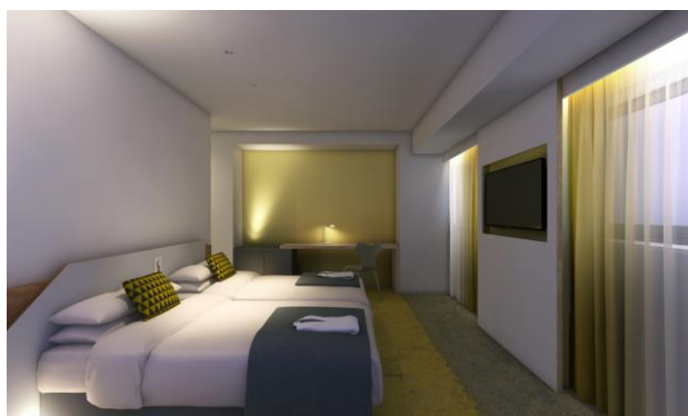
客室(ツインルーム)