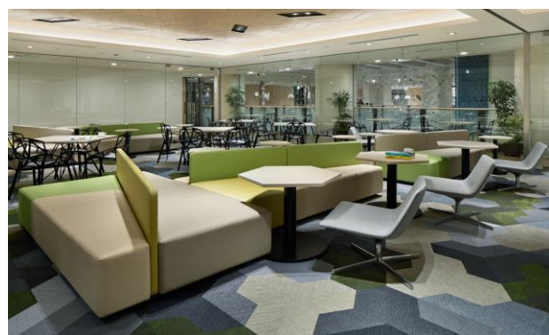
宿泊者専用ラウンジ