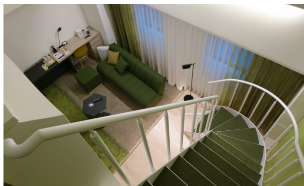
客室(メゾネットルーム)