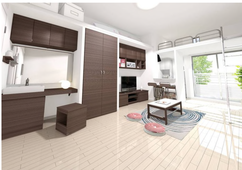
“女性目線”で使い勝手を追求した居室

また、「ノンサウンドシステム」により、床・壁・排水のすべてにおいて遮音対策に力を入れております。