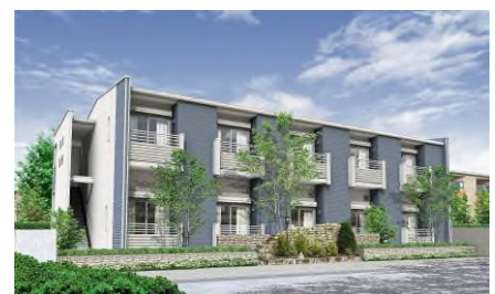
「インナーバルコニー」を採用