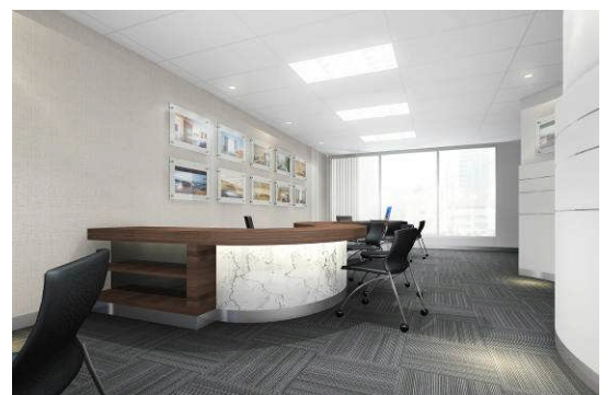
オフィスイメージ

レオパレス21は、2002年4月に韓国ソウル江南支店を設立して以来、日本への留学生等に、日本国内の当社管理アパートへの入居斡旋に係る各種サービス(インバウンド)を提供してまいりました。今後は、海外拠点の機能をさらに強化し、進出する日系企業の皆様に、不動産や生活に係る総合サービス(アウトバウンド)を提供してまいります。