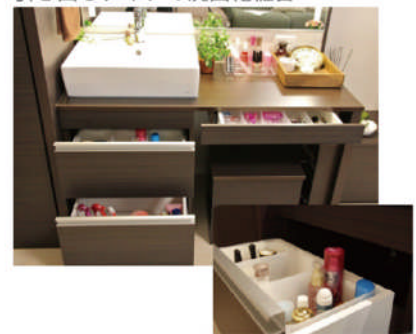
引き出しタイプの洗面化粧台

「ながら美容」の視点を盛り込んだレイアウト。お部屋も広く感じられるようになりました。