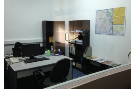
カンボジアオフィス

日系企業様向けにオフィス・住宅の現地賃貸物件のご紹介をし、進出のお手伝いを致します。また、日本への留学生や就労者に対し、国内レオパレス21物件のプロモーション活動にも務めてまいります。