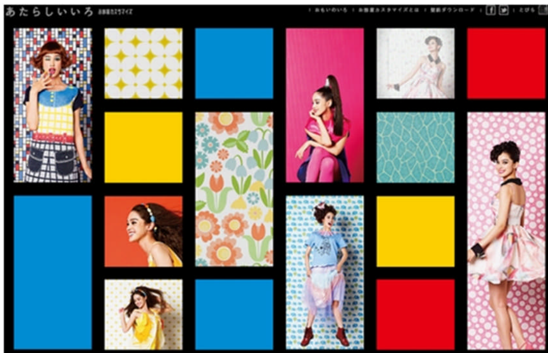
スペシャルサイト TOP イメージ

URL http://www.leopalace21.com/special/customize/atarashii/index.html