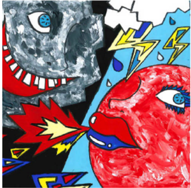
最優秀賞「Cloud, Sun, and You」