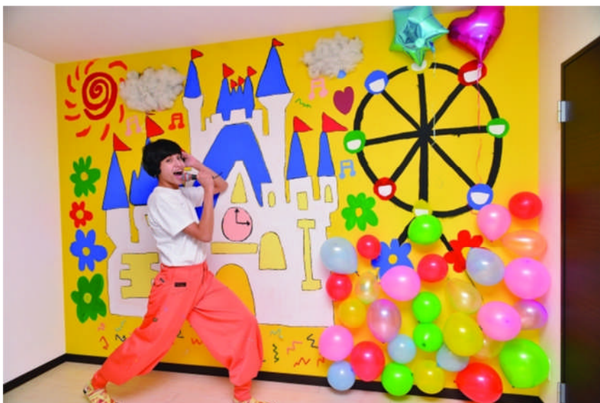
「けみおくん」がカスタマイズしたショールーム

URL http://www.leopalace21.com/special/kemio/index.html