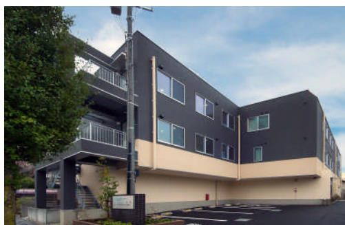
あずみ苑羽村 外観

あずみ苑羽村 http://www.azumien.jp/search/hamura/