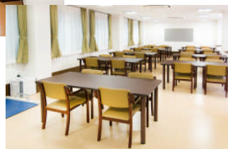
食堂兼機能訓練室