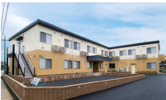
あずみ苑春日井 外観

あずみ苑守山 http://www.azumien.jp/search/moriyama/