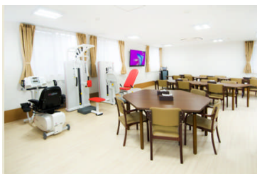
あずみ苑春日井 食堂兼 機能訓練室