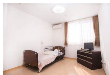
あずみ苑伊勢崎 ショートステイ居室