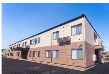
あずみ苑伊勢崎 外観