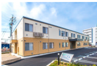
あずみ苑安城 外観