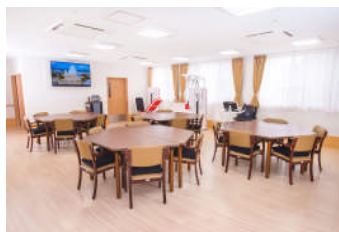
あずみ苑安城 デイサービス食堂兼機能訓練室