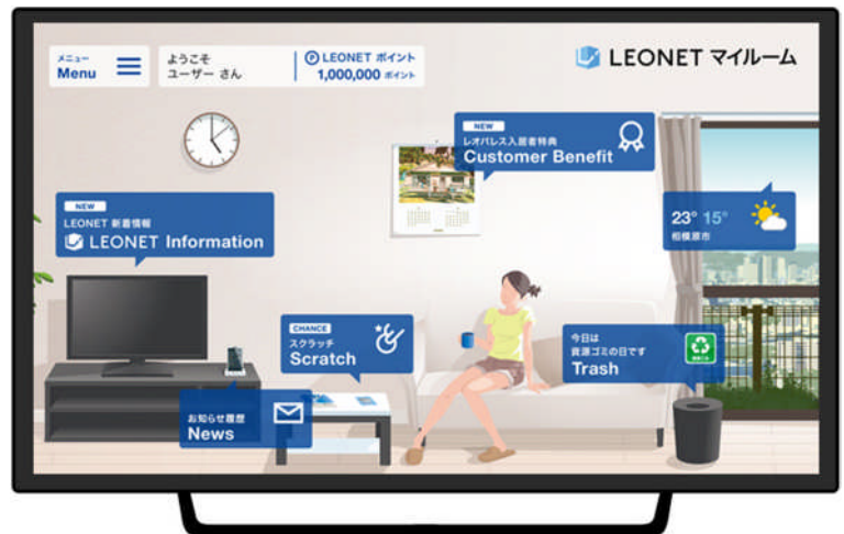
LEONET マイルーム(イメージ)

機能拡充の背景として、スマートデバイスの普及による消費者のライフスタイルの多様化に合わせ、オープンプラットフォームによる拡張性が必要だと考えました。そこで、“あるとうれしいモノ、コト、すべてをあなたの部屋に”というコンセプトのもと、新しく開発した Android TV 対応の STB デバイス「Life Stick」を全国約 56 万戸のレオパレス21物件に標準設備として順次導入し、普段の生活をサポートする「LEONET マイルーム」や、エンタメで生活を豊かにする「LEONET TV」を提供するほか、様々なジャンルの事業者様と提携したパートナーコンテンツの提供も予定しております。