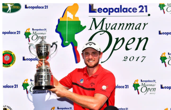
トッド・シノット選手

2017年1月26日(木)～29日(日)、パンラインゴルフクラブにて開催された「レオパレス 21 ミャンマーオープン 2017」はツアープレイヤー145名、アマチュア5名の全150名が出場し、オーストラリアのトッド・シノット選手が最終日に6バーディノーボギーの完璧なゴルフで見事な逆転優勝を飾りました。3日目まで首位だった宮里優作選手、および「レオパレス 21 ミャンマーオープン 2016」2位タイの矢野東選手はトータル9アンダーの6位タイとなる活躍をしました。