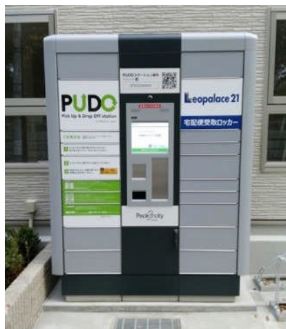
PUDO ステーション (レオパレスクレイノサンシティ八王子)