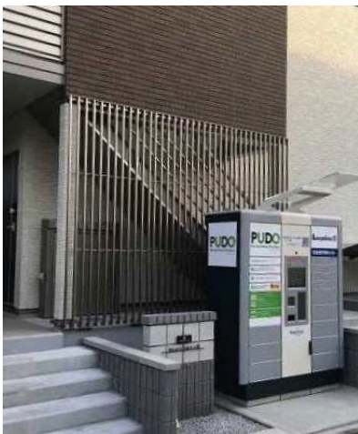
PUDO ステーション (レオパレスクレイノセッソパルシーⅡ)

株式会社レオパレス 21(東京都中野区、社長:深山英世、以下:レオパレス 21)は、Packcity Japan 株式会社(本社:東京都千代田区、社長:リュケ・ジャン・ロラン、以下 Packcity Japan)が提供するオープン型宅配便ロッカー「PUDO ステーション」の当社管理物件への設置が 2018 年 4 月 5 日(木)をもって 50 棟を突破いたしました。